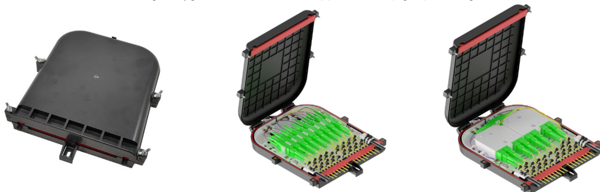
Оптическая кросс-муфта ОКМ-3023-18SC-162-М(П)-18К/2PLC8 (черная) винты с пластиковой головкой